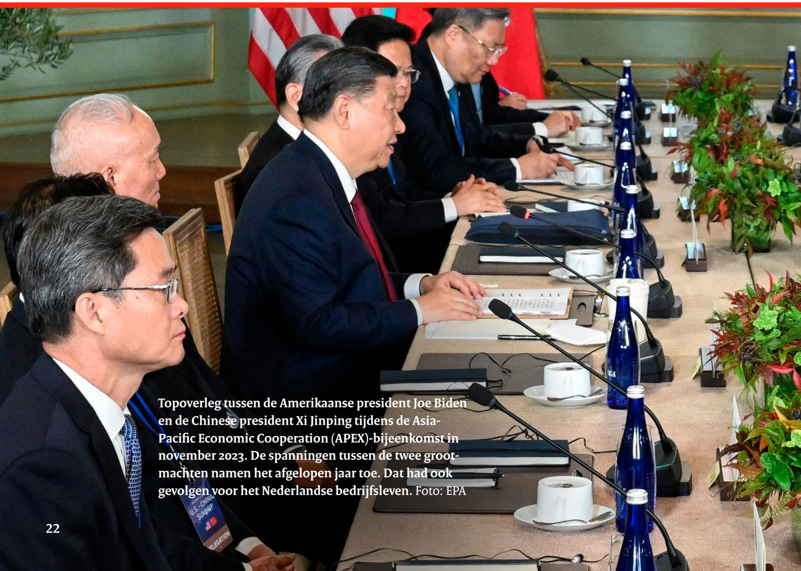
Topoverleg tussen de Amerikaanse president Joe Biden en de Chinese president Xi Jinping tijdens de Asia-Pacific Economic Cooperation (APEC)-bijeenkomst in november 2023. De spanningen tussen de twee grootmachten namen het afgelopen jaar toe. Dat had ook gevolgen voor het Nederlandse bedrijfsleven.