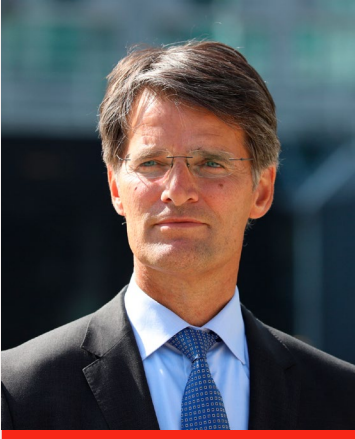
Erik Akerboom Directeur-generaal Algemene Inlichtingen- en Veiligheidsdienst

De veiligheid van Nederland is sterk verbonden met de veiligheid in de wereld. In de recente geschiedenis bleek dat zelden zo duidelijk als in 2023. Sprekend daarvoor zijn twee data.